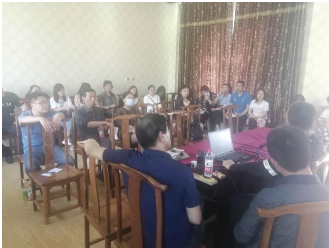
图3 参加朔州金沙滩研学旅行课程研发及教材编写项目