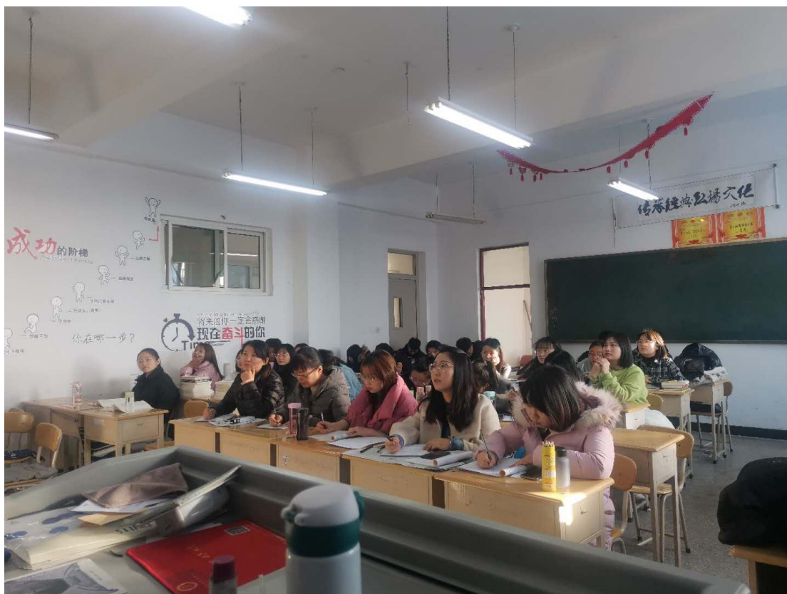
图 4 组织新教师课堂观摩（图片第一排为教师）

成立工作室以来对新教师培养分步进行：本着教学——科研——实践的步骤进行，在 2019--2020 学年第一学期完成了两次新教师培训。