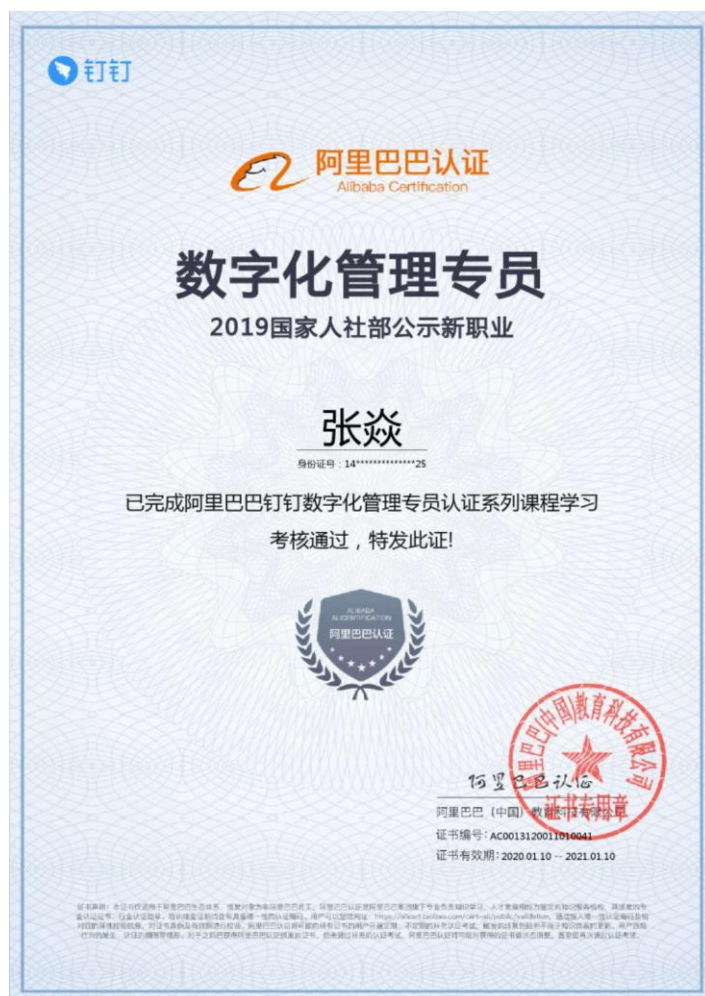
图 15 张焱完成阿里巴巴数字化管理专员认证