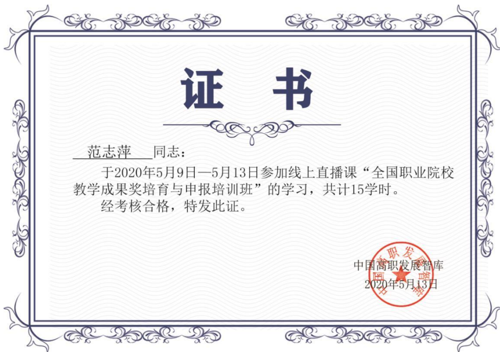
图 13 范志萍完成全国职业院校教学成果奖培育与申报培训班学习