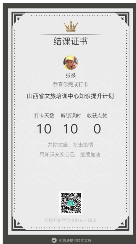
图 14 张焱完成山西省文旅培训中心知识提升计划学习