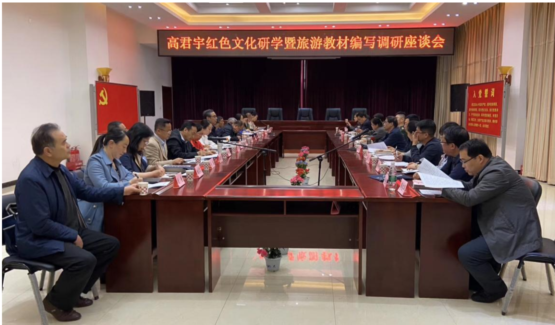
图2 参加娄烦红色研学旅行课程研发及教材编写项目