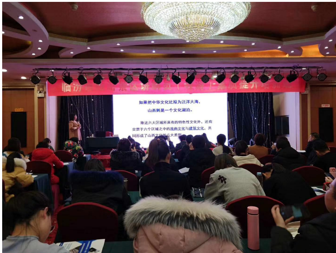
图 8 魏莉霞为临汾市景区讲解员培训