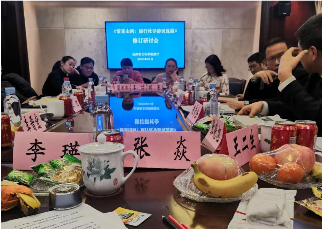
图1 参加《情系山西：旅行社导游词选编》修订研讨会