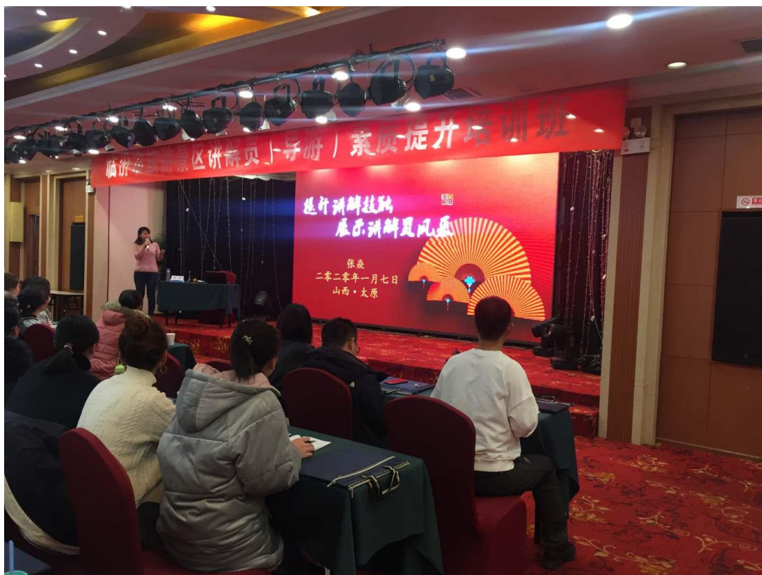
图 7 张焱为临汾市景区讲解员培训